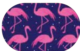
Flamant Rose Eclipse