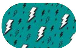
Bleu Eclairs Eclipse