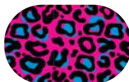
Léopard Rose Eclipse