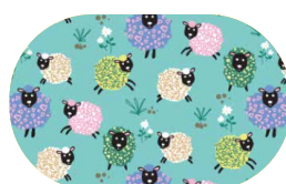
Motif Enfant Moutons Eclipse