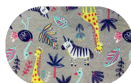
Motif Enfant Giraffe Zèbre Eclipse