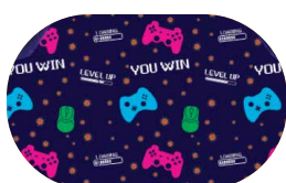
Motif Enfant Jeux Vidéo Eclipse