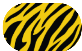
Zèbre Jaune Eclipse