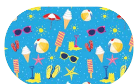
Motif Enfant Plage Eclipse