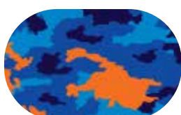
Bleu/Orange Camouflage Eclipse